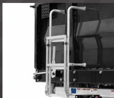
Ladder op voorwand