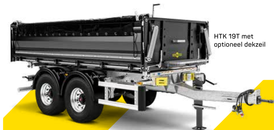
HTK 19T met optioneel dekzeil

Met een toelaatbaar totaalgewicht van 19 ton is de HTK 19t niet alleen geschikt voor bulkmaterialen zoals aarde, zand, grind en beton, maar ook voor bouwmaterialen zoals bakstenen en betonblokken. De tandem driewegkipper is ontworpen voor palletbreedte en maakt ook veilig transport van gepalleteerde goederen mogelijk. Zijn optimale rij- en kiepkenmerken maken hem ook tot een onmisbare helper, vooral voor zware toepassingen – en dit alles met een relatief laag tarragewicht. De kiepbak is standaard voorzien van een kathodische dompellakcoating en lakafwerking.