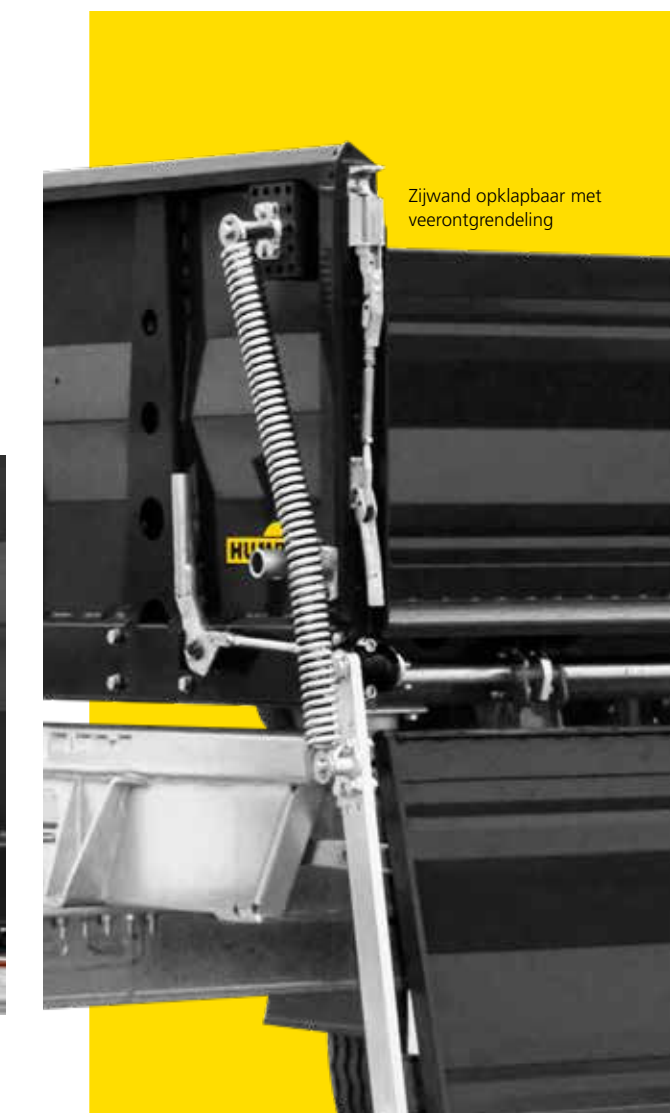
Zijwand opklapbaar met veerontgrendeling