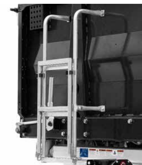
Ladder op voorwand