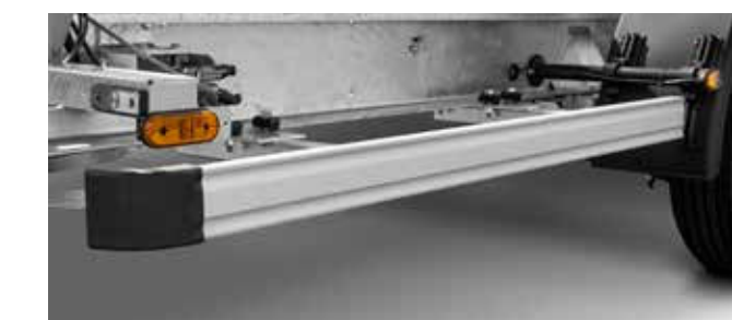
Doordachte functionaliteit tot in het kleinste detail