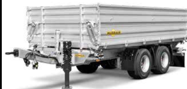
HTK 18T met opzetzijwand

Technische wijzigingen voorbehouden. Alle afmetingen zijn richtwaarden en hebben betrekking op het serievoertuig zonder accessoires. Extra uitrusting verandert het eigengewicht en het draagvermogen!