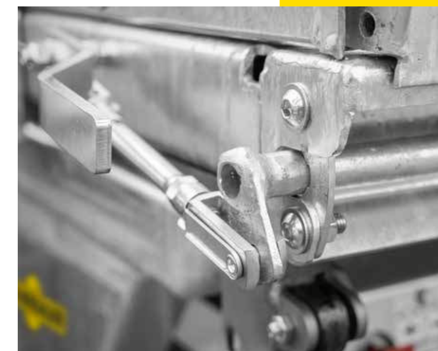
Handmatige centrale vergrendeling voor zijwanden

Doordachte functionaliteit tot in het kleinste detail