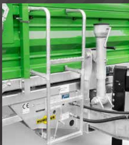
Ladder op voorwand