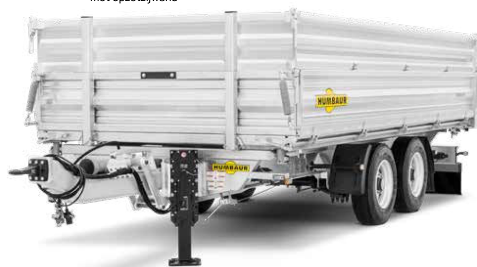
HTK 10T met opzetzijwand

De unieke kattelbrug is bestand tegen de hoogste belastingen en puntbelastingen. Dankzij de opklapbare en uitschuifbare steunpoten of de optioneel verkrijgbare oprijplaten van aluminium, die worden opgeborgen in een in het chassis geïntegreerde schacht, kan de trailer vrijwel onbeperkt worden gebruikt in de bouwsector.