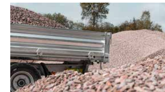
Doordachte functionaliteit tot in het kleinste detail

Meer informatie in de video https://www.youtube.com/watch?v=YSHii7PSIU