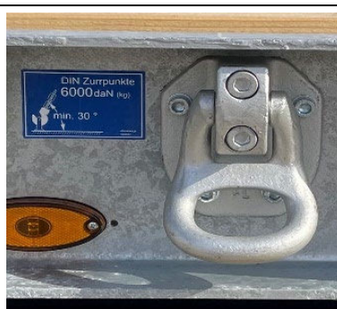
Vastschroefbare en achteraf monteerbare sjorringen