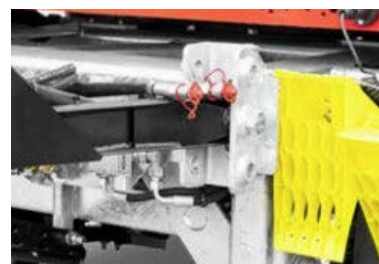
3 posities voor de dissel