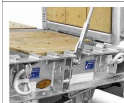
Klimrails in buitenframe, vlakbij rampen