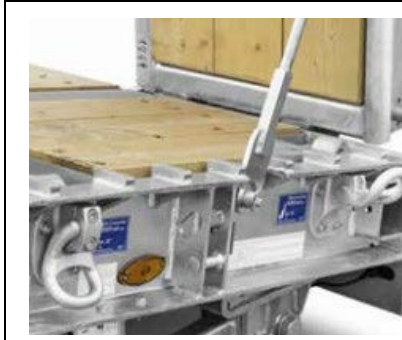
Klimrails in buitenframe, vlakbij rampen