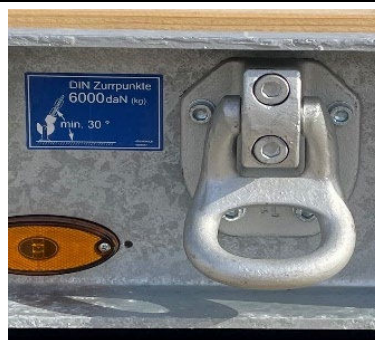
Vastschroefbare en achteraf monteerbare sjorringen