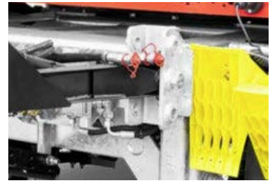
3 posities voor de dissel