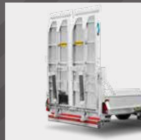
Eendelige brede oprijplaat met stalen tralierooster