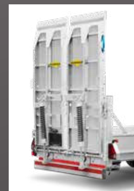
Oprijplaat met tralierooster en hydraulische oprijplaatlift

Reservewiel en -houder Duomatic koppeling Veerkrachtcilinder Sjorrog Ø 50 mm Dissel voor verschillende lengtes en koppelingshoogtes Zwenktrekoog met Ø 40/50 mm trekoog 7-pins stopcontact op achterzijde Achteruitrijlamp Werklamp Zwaailicht met 7-pins stopcontact LED-zwaailicht Zeefdrukvloer Verzinkte tranenplaat Aluminium wanden met verzinkte middenrongen Stalen wanden met verzinkte middenrongen Botsbeveiliging heftruck H-frame met stalen rooster Steunpoten Insteekronden Steun aan voorwand Containervergrendeling Kunststof gereedschapskist Reflecterend markeringsbord Achtermarkeringsbord Insteekbare achterwand Oprijplaat met tralierooster Hydraulische oprijplaatlift