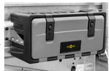
Optioneel te monteren kunststof gereedschapsbox