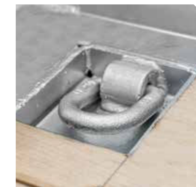
Doordachte functionaliteit tot in het kleinste detail