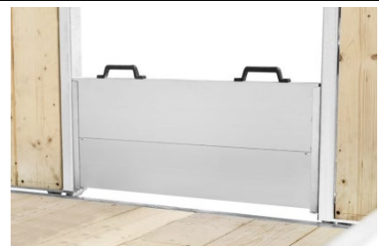
Zijdelings verschuifbare oprijplaten, optionele insteekwand