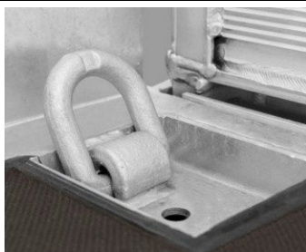
Sjorpunten verzonken in brugvloer