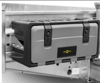
Optioneel kunststof werkkoffer