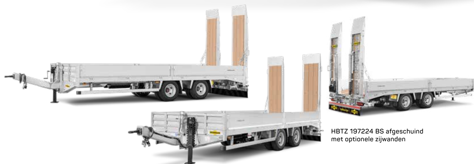
HBTZ 197224 BS afgeschuind met optionele zijwanden