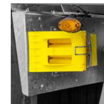
Doordachte functionaliteit tot in het kleinste detail