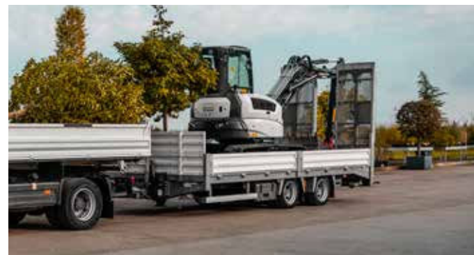
HBTZ 197224 BS afgeschuind standaard zonder zijwanden

Onze multifunctionele trailers uit de HBTZ BS-serie zijn duurzaam gebouwd met een thermisch verzinkt chassis. Inklapbare steunpoten en een geringe laadhoogte zorgen voor veiligheid en gemak bij het in- en uitladen. Dankzij de standaard verlaagbare luchtvering en de 3100 mm lange oprijplaten blinkt deze trailer uit met een oprijhoek van slechts 13 graden.