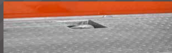
Geribde staalplaat op vloer