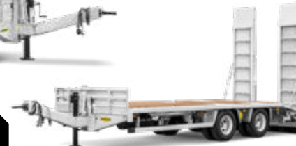
HBTZ 197224 BS afgeschuind standaard zonder zijwanden