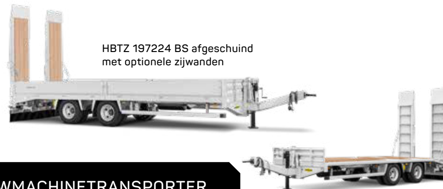
HBTZ 197224 BS afgeschuind met optionele zijwanden