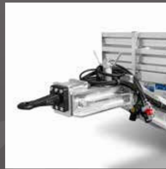
Zwenktrekoog met diameter 40/50 mm trekoog