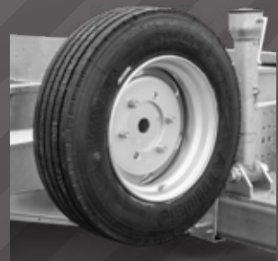
Reservewiel en -houder