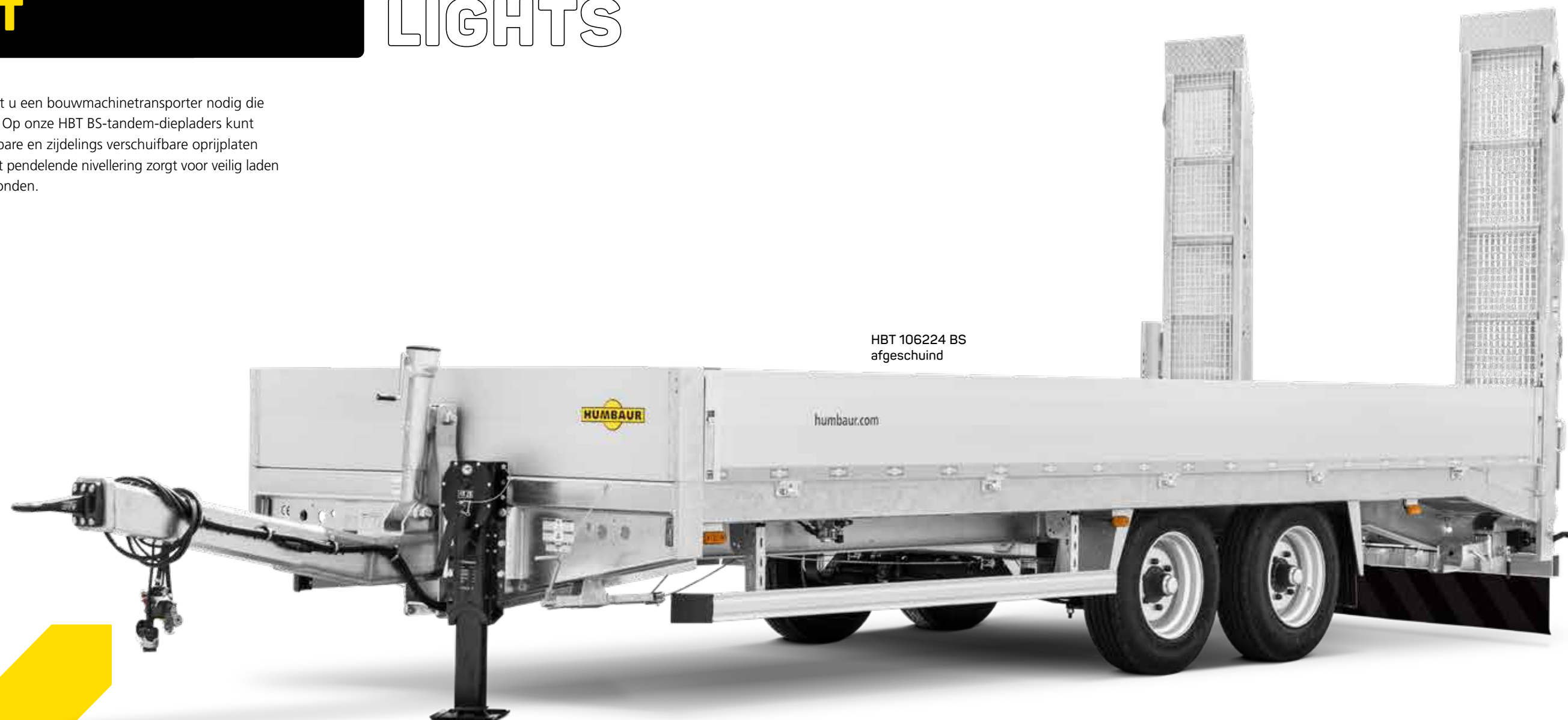
HBT 106224 BS afgeschuind

Als u op bouwplaatsen werkt, hebt u een bouwmachinetransporter nodig die u ongewone transportopties biedt. Op onze HBT BS-tandem-diepladers kunt u uw bouwmachines over opklapbare en zijdelings verschuifbare oprijplaten laten rijden. Het speciale chassis met pendelende nivellering zorgt voor veilig laden en rijden, zelfs op slechte ondergronden.