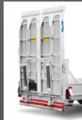
Laadklep uit een stuk met tralierooster