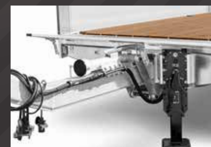
Dissel voor verschillende lengtes en koppelingshoogtes