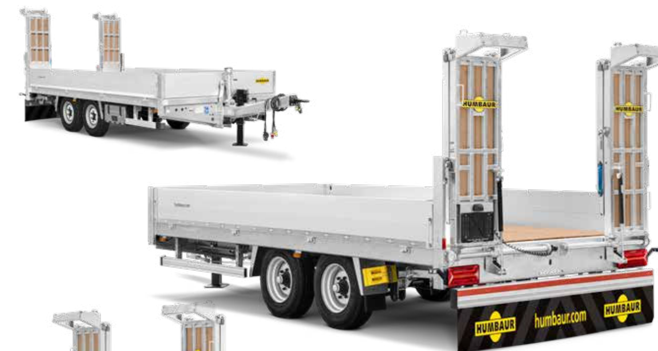
HBT 105224 BS recht