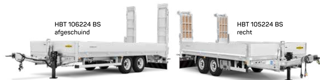
HBT 106224 BS afgeschuind