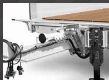
Dissel voor verschillende lengtes en koppelingshoogtes