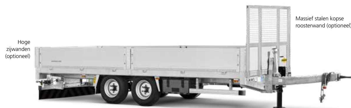
Massief stalen kopse roosterwand (optioneel)