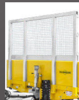
Massieve achterwand van stalen rooster