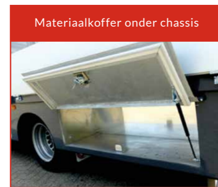
Materiaalkoffer onder chassis