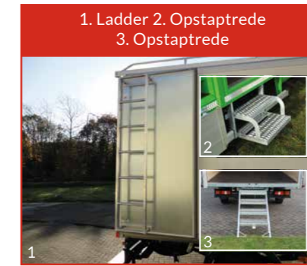
1. Ladder 2. Opstaptrede 3. Opstaptrede