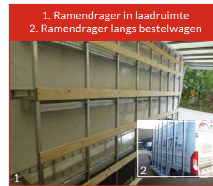
1. Ramendrager in laadruimte 2. Ramendrager langs bestelwagen