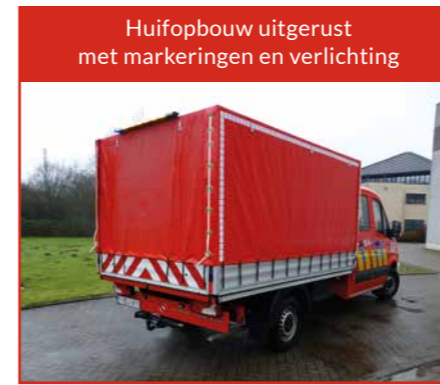
Huifopbouw uitgerust met markeringen en verlichting