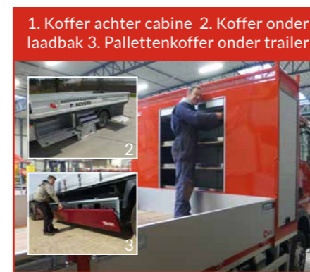
1. Koffer achter cabine 2. Koffer onder laadbak 3. Pallettenkoffer onder trailer