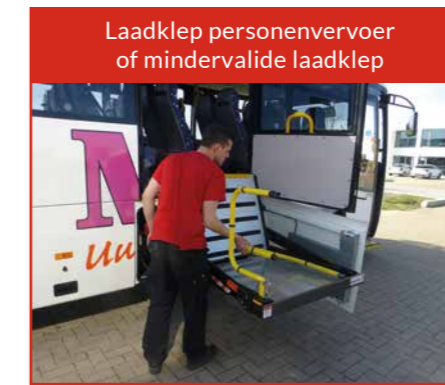
Laadklep personenvervoer of mindervalide laadklep