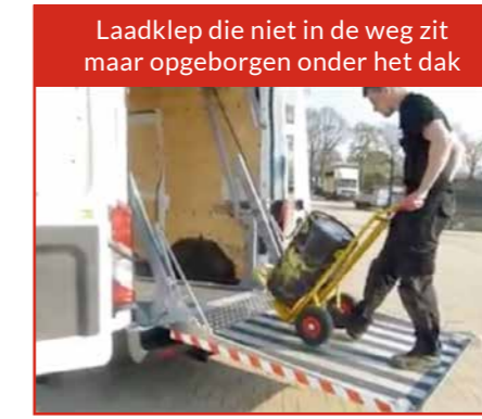
Laadklep die niet in de weg zit maar opgeborgen onder het dak