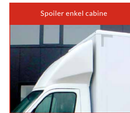
Spoiler enkel cabine