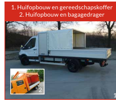
1. Huifopbouw en gereedschapskoffer 2. Huifopbouw en bagagedrager