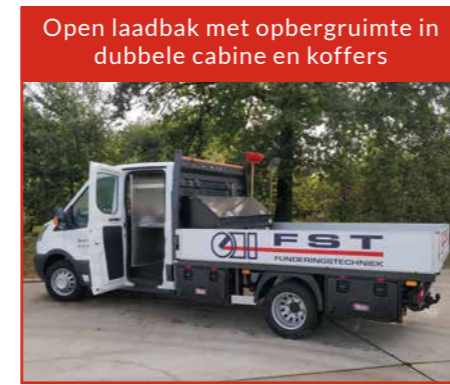
Open laadbak met opbergruimte in dubbele cabine en koffers