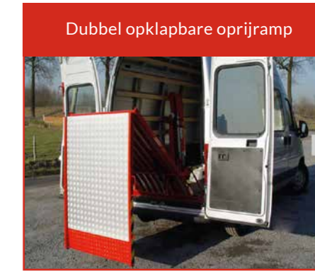
Dubbel opklapbare oprijramp