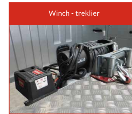
Winch - treklier