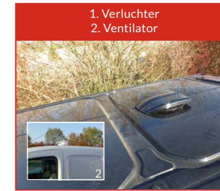
1. Verluchter 2. Ventilator