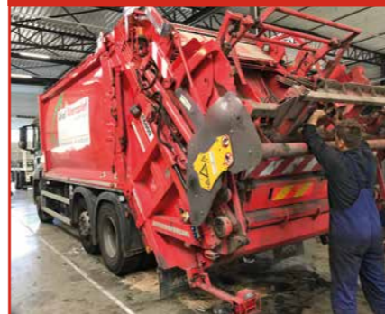
Herstellen en preventief onderhoud vuilniswagens