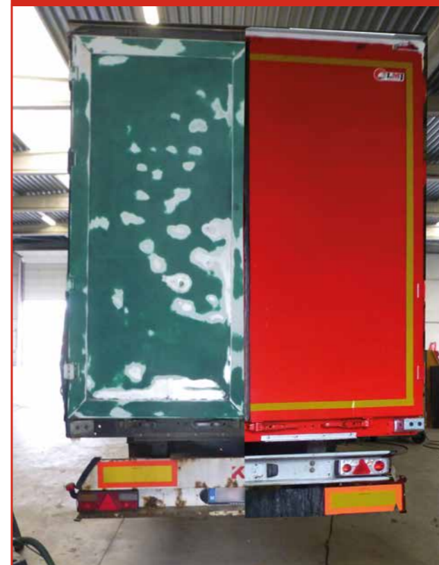
Renovatie en transformatie (Voor / Na)