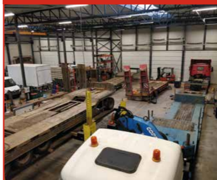
Service en onderhoud aan opleggers en diepladers