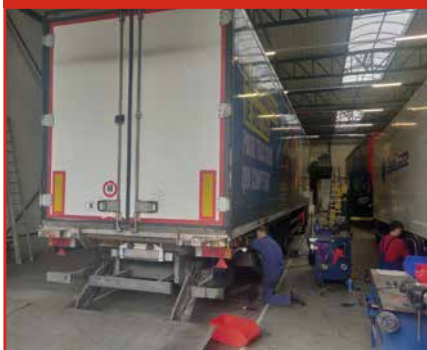
Periodiek onderhoud & herstelling van gebruikschade