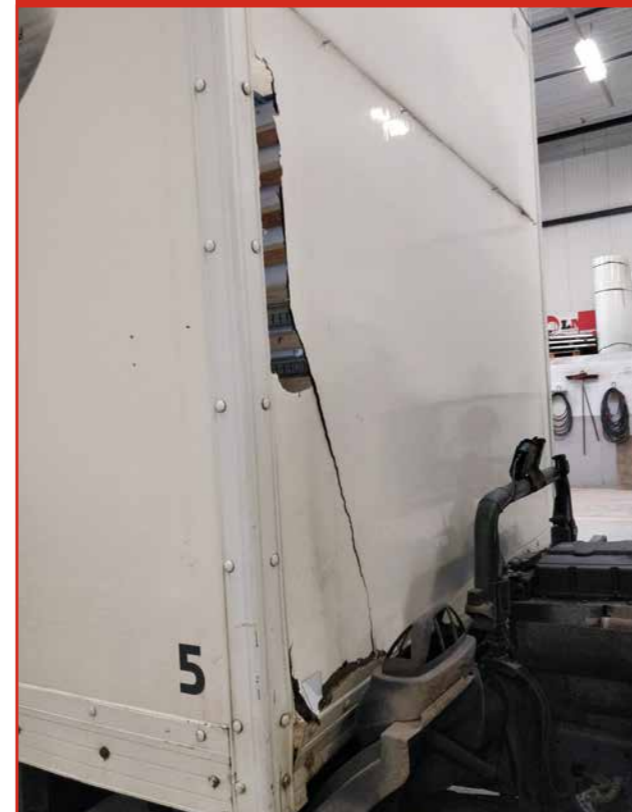
Vernieuwen van zijwanden/ voorbord na ongevalschade