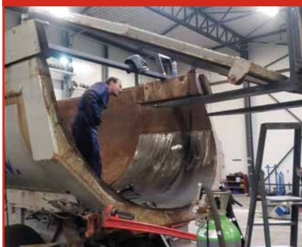
Lassen van bodem in kipbak, staal, aluminium